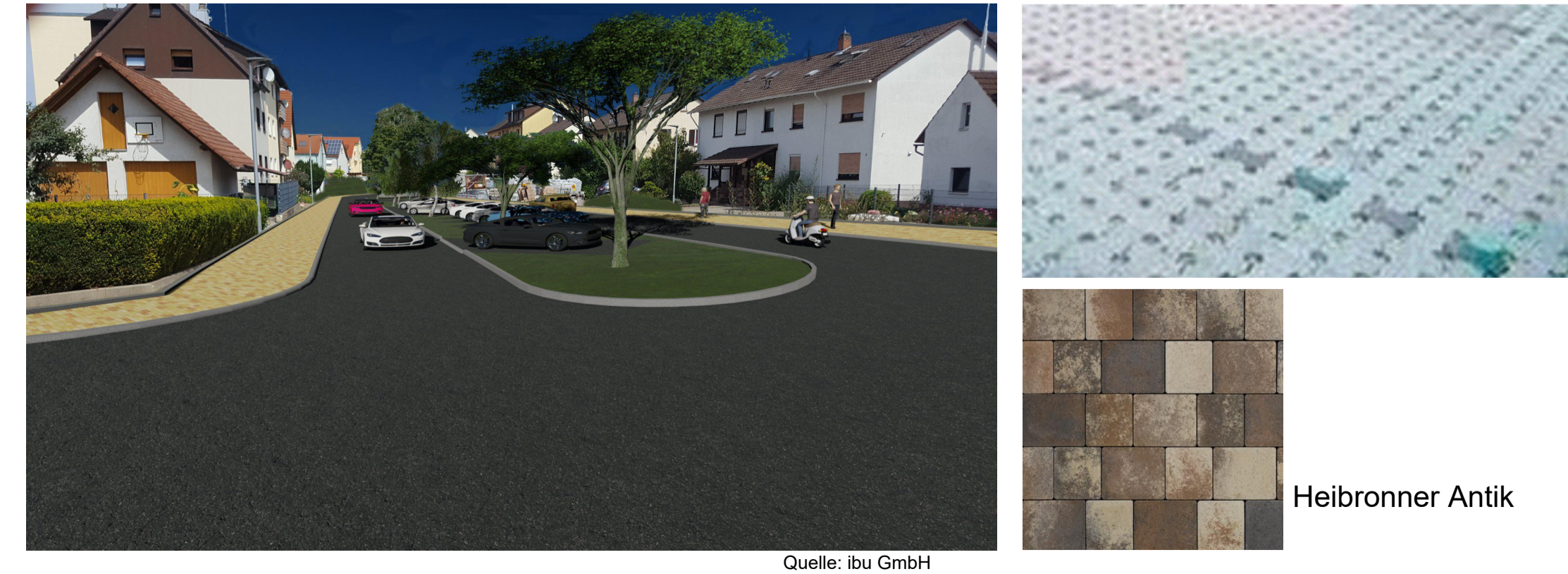
Rasengitterpflaster mit Fuge 4 cm, kronit