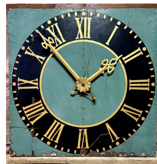
Historisches Zifferblatt mit den originalen Zeigern von 1874