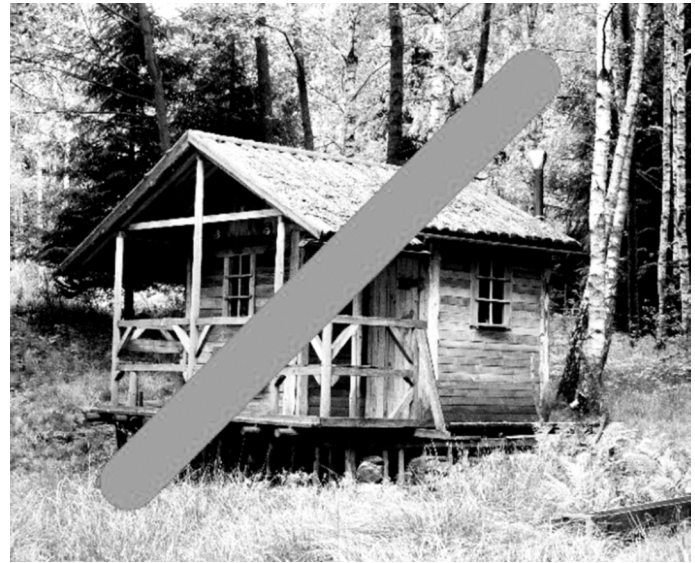
Beispiel unzulässige Hütte