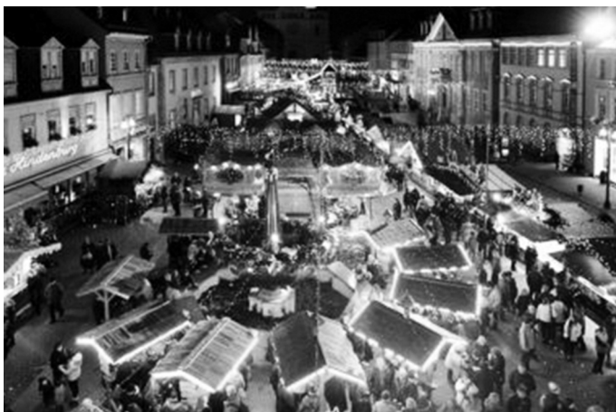
(Fotovermerk: Weihnachtsmarkt Speyer @Klaus Venus)