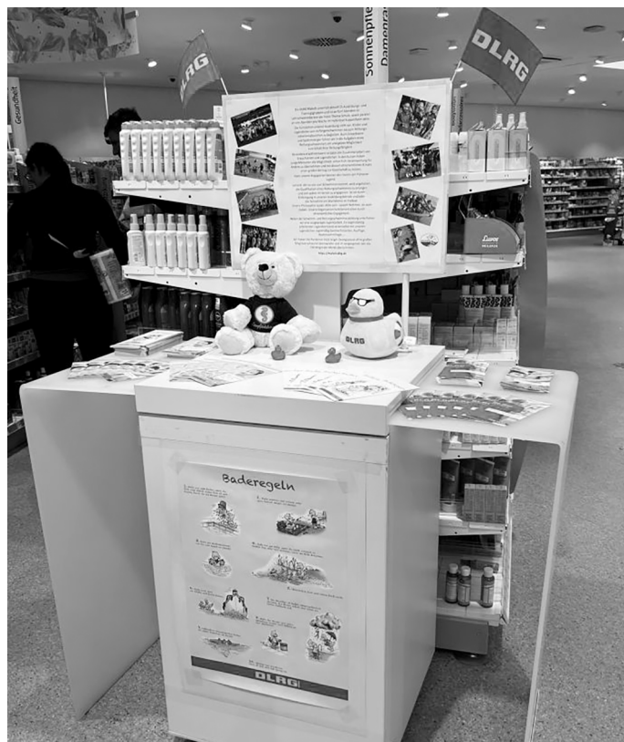
Die Präsentation der DLRG im dm-Drogeriemarkt während des Aktionszeitraumes

Die Konzeption unserer Ausbildung sieht vor, Kinder und Jugendliche vom Anfängerschwimmen bis zum Rettungsschwimmabzeichen zu begleiten. Auch Erwachsene und Späteinsteiger führen wir in die Aufgaben eines Rettungsschwimmers ein und geben Möglichkeit zum Erhalt ihrer Rettungsfähigkeit. Besonders erwähnenswert ist dabei die Zusammen-