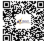
QR-Code hier scannen:

Pass und Meldeamt: 07246 707-103 Ordnungsamt: 07246 707-120 Bauamt: 07246 707-304 Zentrale: 07246 707-0