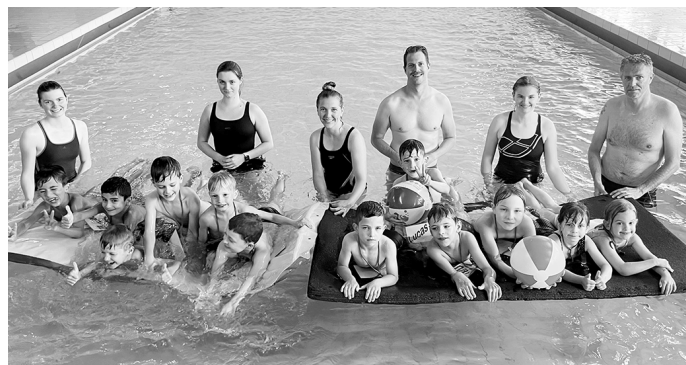
Kinder und Betreuer der aktuellen Anfängerschwimmkurse im Lehrschwimmbecken

von 17.30 bis 20.00 Uhr. Trotz vielfältigem Angebot ergeben sich aufgrund der großen Nachfrage mittlerweile auch längere Wartezeiten für Kinder, die unsere Bronze-, Silber- oder Gold-Kurse besuchen möchten.