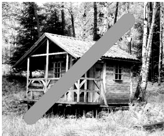
Beispiel unzulässige Hütte

Pro Grundstück ist maximal eine Geschirrhütte zulässig. Die Farbe und das Material sind der Natur anzupassen, so dass die Hütte möglichst unauffällig ist.