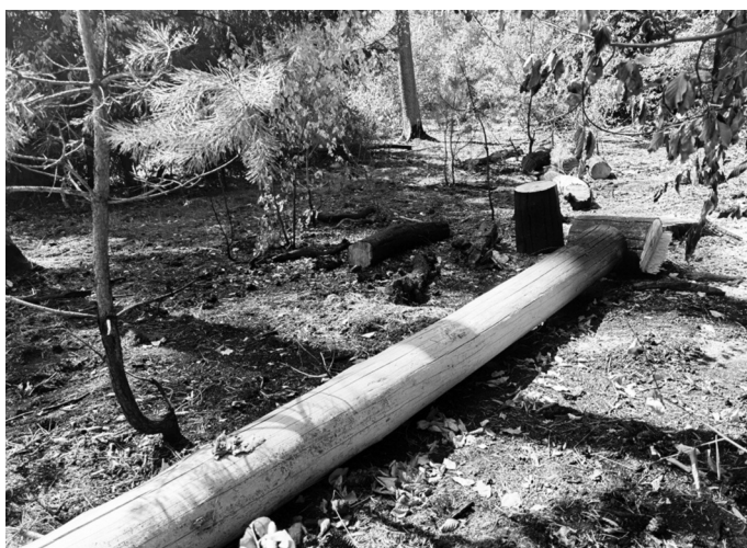
Dieser Waldbrand ging noch glimpflich aus, weil die Feuerwehr rechtzeitig vor Ort war und ein Übergreifen auf die Baumkronen verhindern konnte.

„Uns bereitet die gegenwärtige Situation große Sorgen“ sagt Arne Glückstein vom Forstbezirk Westlicher Schwarzwald, dessen Büro in Bad Herrenalb ist. Diese Bedenken sind nicht unbegründet: Aufgrund der langen Dürre sind Waldboden und Bodenvegetation extrem trocken und die hier vorherrschenden Nadelbäume brennen leichter als Laubbäume. Hinzu kommt das unwegsame Gelände im Forstbezirk, so dass mögliche Brandherde erst spät entdeckt und sich die Feuer stark ausbreiten können, ehe die Feuerwehr zur Stelle ist. Wie schnell ein Waldbrand große Flächen zerstören kann, haben die jüngsten Waldbrände rund um Karlsruhe gezeigt. Nur die frühzeitige Brandmeldung durch die Bürger und das