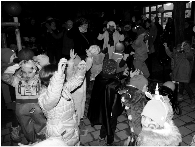
Rundum war es ein schönes Fest. Wir bedanken uns bei allen, die zum guten Gelingen des Festes beigetragen haben.